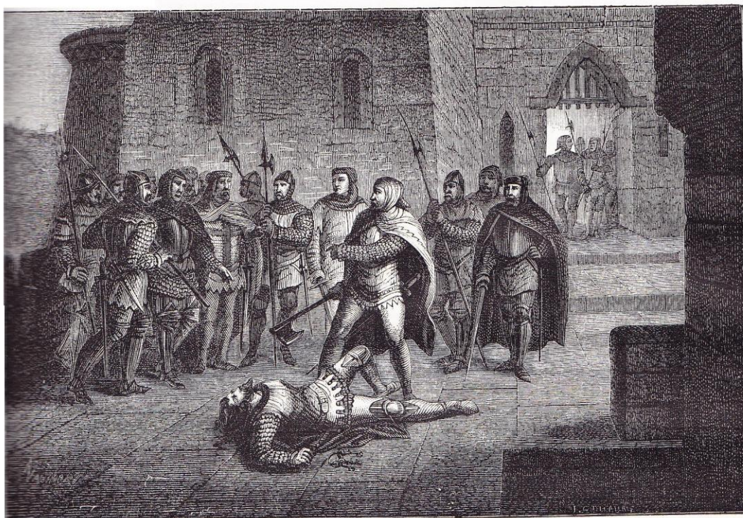
Mort d'Étienne Marcel.

bannière royale bleue aux fleurs de lis d'or, et, poussant le cri de guerre des rois de France : Montjoie Saint-Denis! il courut aux halles pour soulever le peuple.